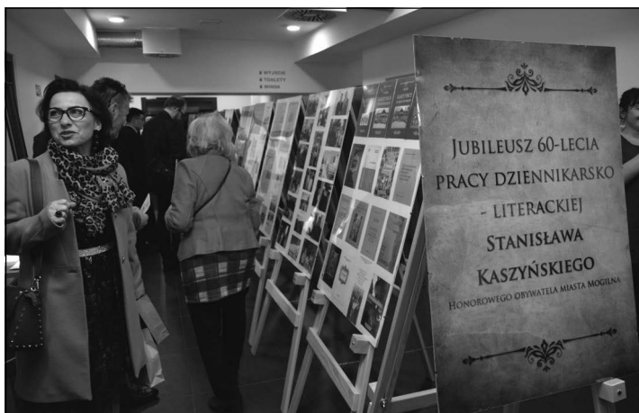
Zaproszenie na wystawę