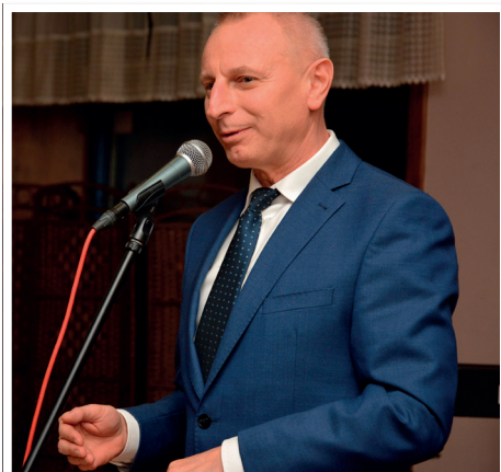
Prezydent Inowrocławia Ryszard Brejza