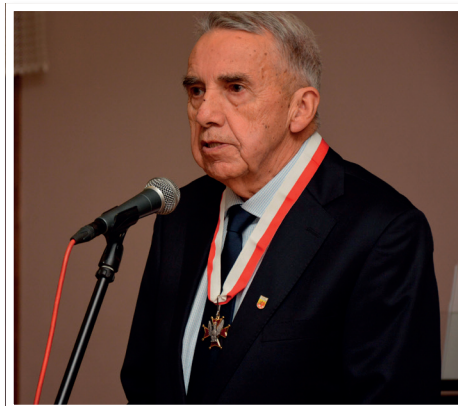
Jubilat wyróżniony Medalem 25-lecia Muzeum Niepodległości w Warszawie